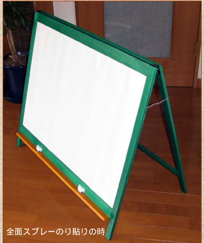
全面スプレーのり貼りの時

この“くの字”探しに苦労した。 Net でも見つからないしホームセンターにもないし、これも作ろうかなと思っていた矢先に偶然カインズで発見した。ところが、店内改装工事で撤去されてしまい、今はもう入手できない・・・あ～あ、その後津久井の“Jマート”で発見！ 以外な所にあるもんだ。