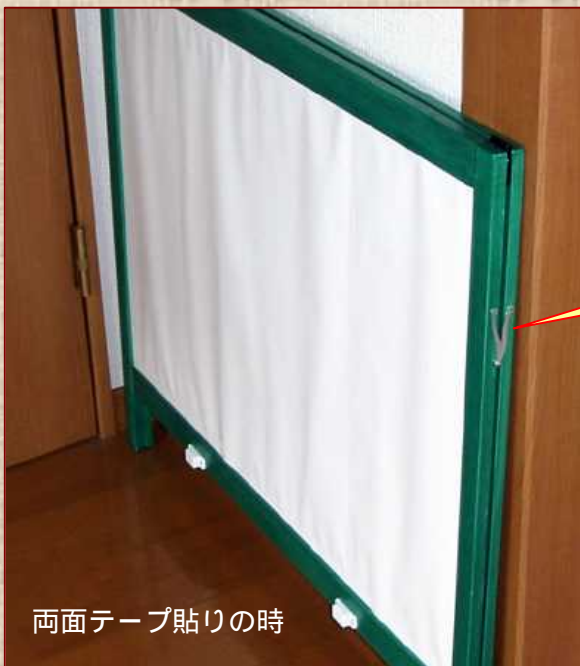
両面テープ貼りの時

この“くの字”探しに苦労した。 Net でも見つからないしホームセンターにもないし、これも作ろうかなと思っていた矢先に偶然カインズで発見した。ところが、店内改装工事で撤去されてしまい、今はもう入手できない・・・あ～あ、その後津久井の“Jマート”で発見！ 以外な所にあるもんだ。